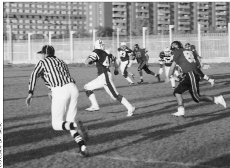
Partido de la temporada 91-92, cuando Pioners jugaba en L'H