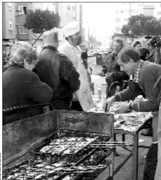
Sardinada popular en el mercado de la Florida