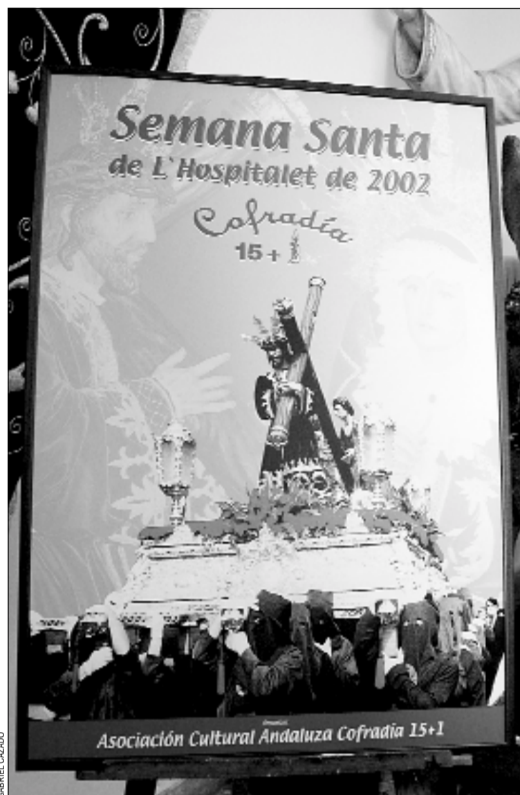
Cartel para la Semana Santa de este año

El auge de las procesiones hospitalenses queda patente en sus cifras. Es la única Cofradía que saca nueve procesiones y a las que en el año 2001 asistieron más de 500.000 personas.