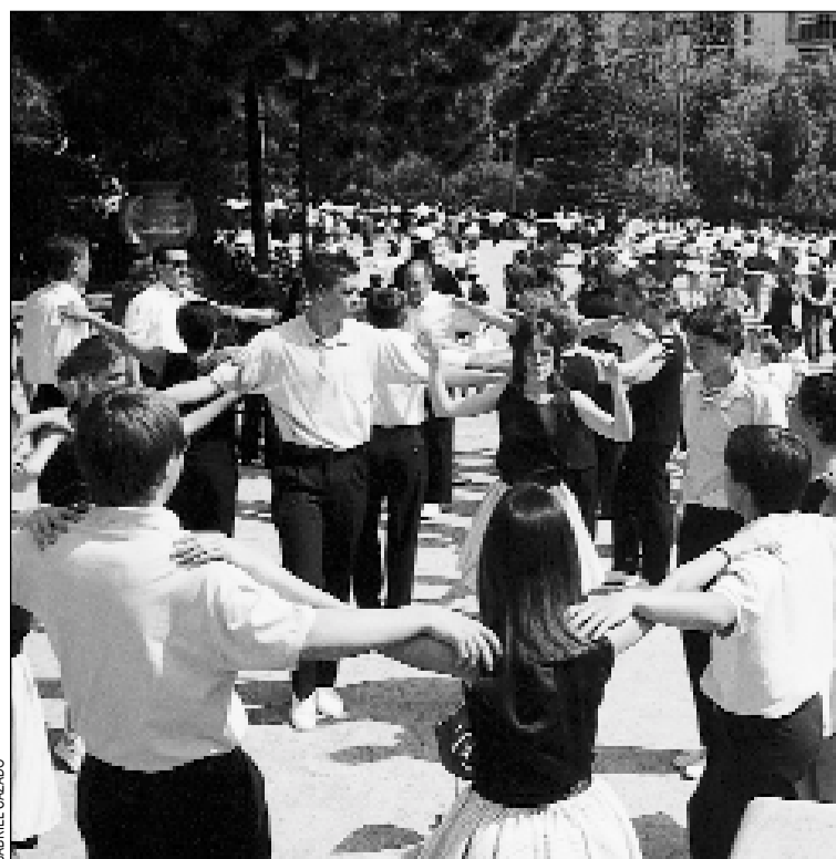
Imagen de una ballada de sardanes en el Parc de Can Buxeres

grupo de animación. Por último, la Florida desfiló con los diablos y diablas desde la calle Diógenes al parque del Sepu, donde juzgó y quemó a su majestad el Carnaval.