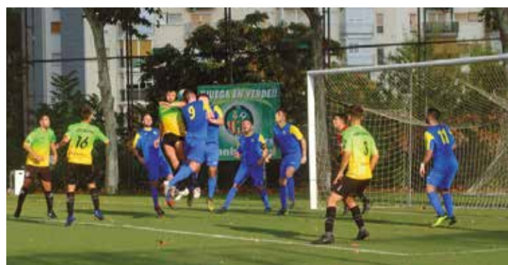
El Can Buxeres debutó con derrota ante el Fontsa-Fatjó