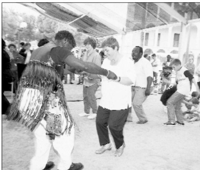
La Festa de la Diversitat és sinònim d'intercanvi cultural