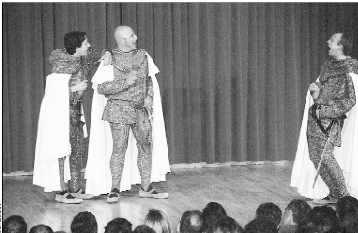
La tramoya, de Fuenteovejuna, en un momento de la representación de la obra de Lope de Vega