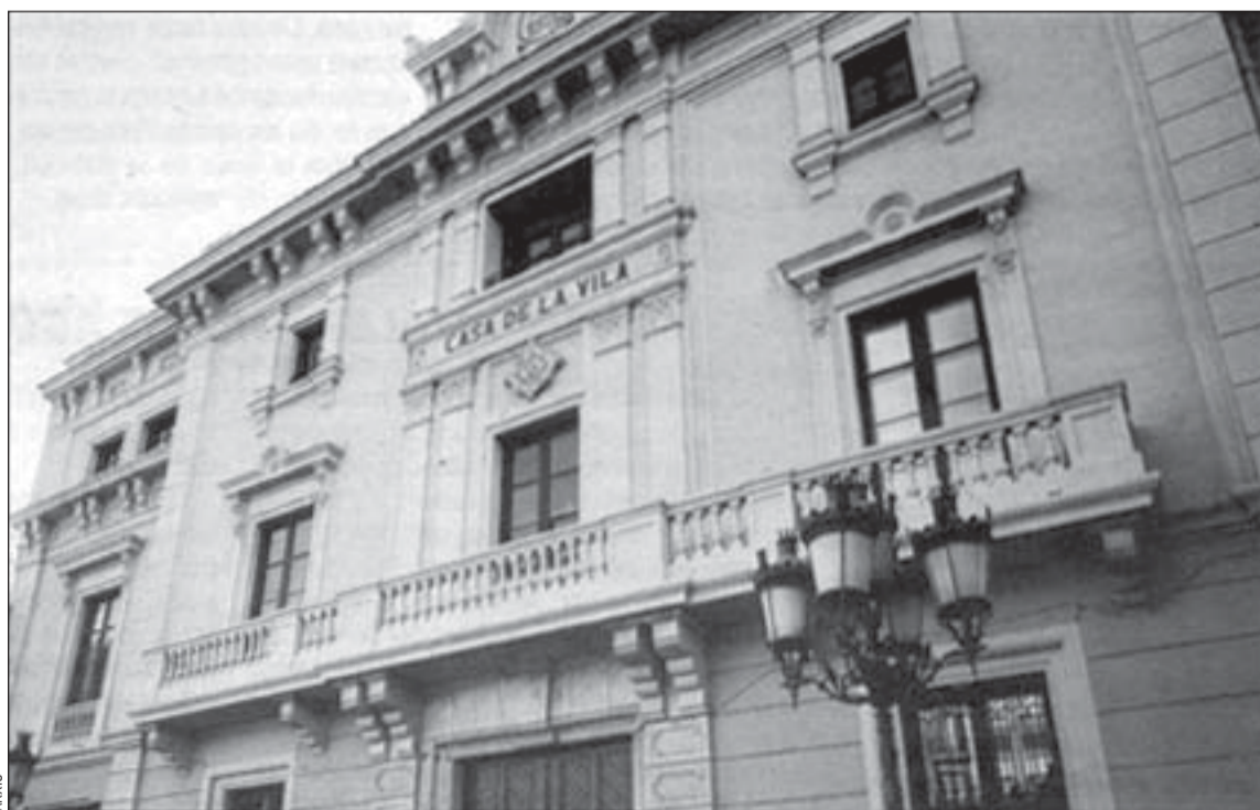
Los hospitalenses elegirán el próximo consistorio el día 28 de mayo

pa, ya que se habrá producido un cambio generacional al no estar presentes por primera vez ninguno de los concejales de la primera legislatura, la del 79. Torres aludió al cariño y a la solidaridad demostrada entre los componentes de las diferentes formaciones políticas en