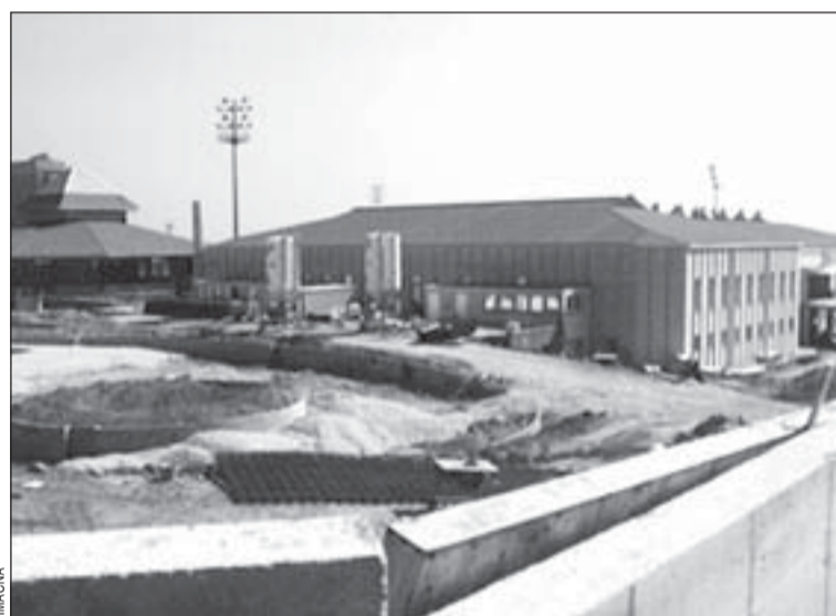
Noves instal·lacions complementàries per a aquest polisportiu

ta Eulàlia, entre 3.000 i 3.500. La gestió dels polisportius té dues modalitats: o la realitza una entitat esportiva en conveni amb l'Ajuntament (Les Planes, amb l'AE L'Hospitalet; S. Eulàlia, amb l'AESE, i, en el futur, Bellvitge, amb Bellsport) o una empresa també en conveni (L'H Nord, amb Eucagest), o bé la fa directament l'Organisme Autònom Municipal d'Esports (OAME).