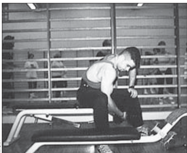
El gimnàs acull activitats d'aeròbic i musculació

Tot i que la empresa Eucagest, encarregada de la gestió, tenia la intenció d'obrir al gener, finalment aquest complex serà accessible al públic general d'aquí a poques setmanes. Recordem que algunes entitats ja disputen partits oficials en aquest polisportiu. La zona s'està millorant, segons mana el conveni de gestió, amb noves instal·lacions complementàries i quan estigui finalitzada -en un màxim de dos anys- es podrà practicar un ventall encara més ampli d'esports. L'abonament general costarà 3.600 pessetes i s'han contemplat descomptes familiars, per a menors i per viure a L'Hospitalet. El Complex es troba al quilòmetre 617 de la Nacional II, a Pubilla Casas, i el seu telèfon és el 448 20 23.