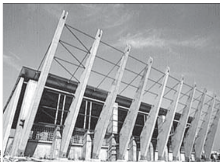
El polisportiu de Bellvitge combina utilitat i disseny