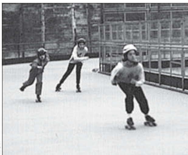
La pista de patinatge és l'única de la ciutat