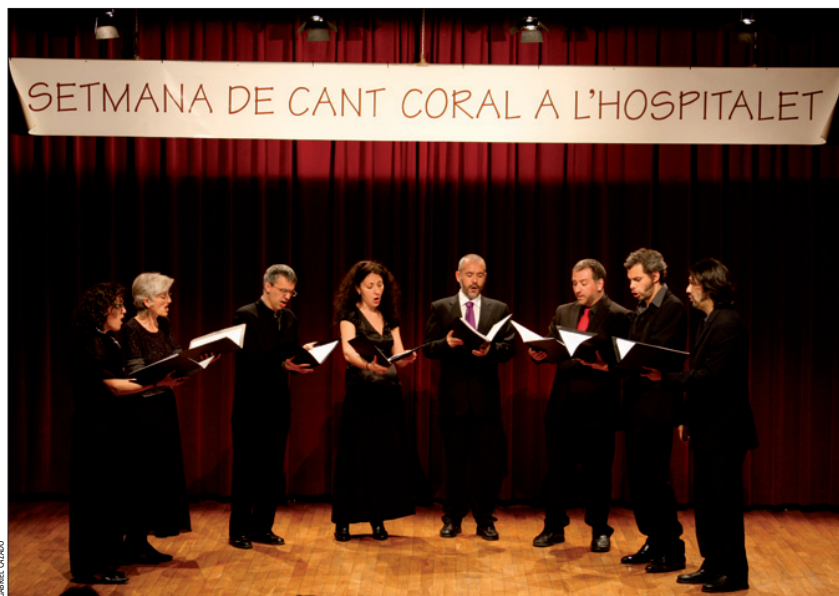
Actuació de la Setmana de Cant Coral de L'Hospitalet l'any 2009