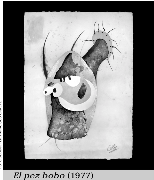
El pez bobo (1977)

Trabajador de artes gráficas, su profesión le ha permitido conocer las herramientas más avanzadas en grafismo digital y las ha aplicado a su obra. Ha escaneado los bocetos para trasladarlos después al ordenador. A partir de aquí les ha dado forma