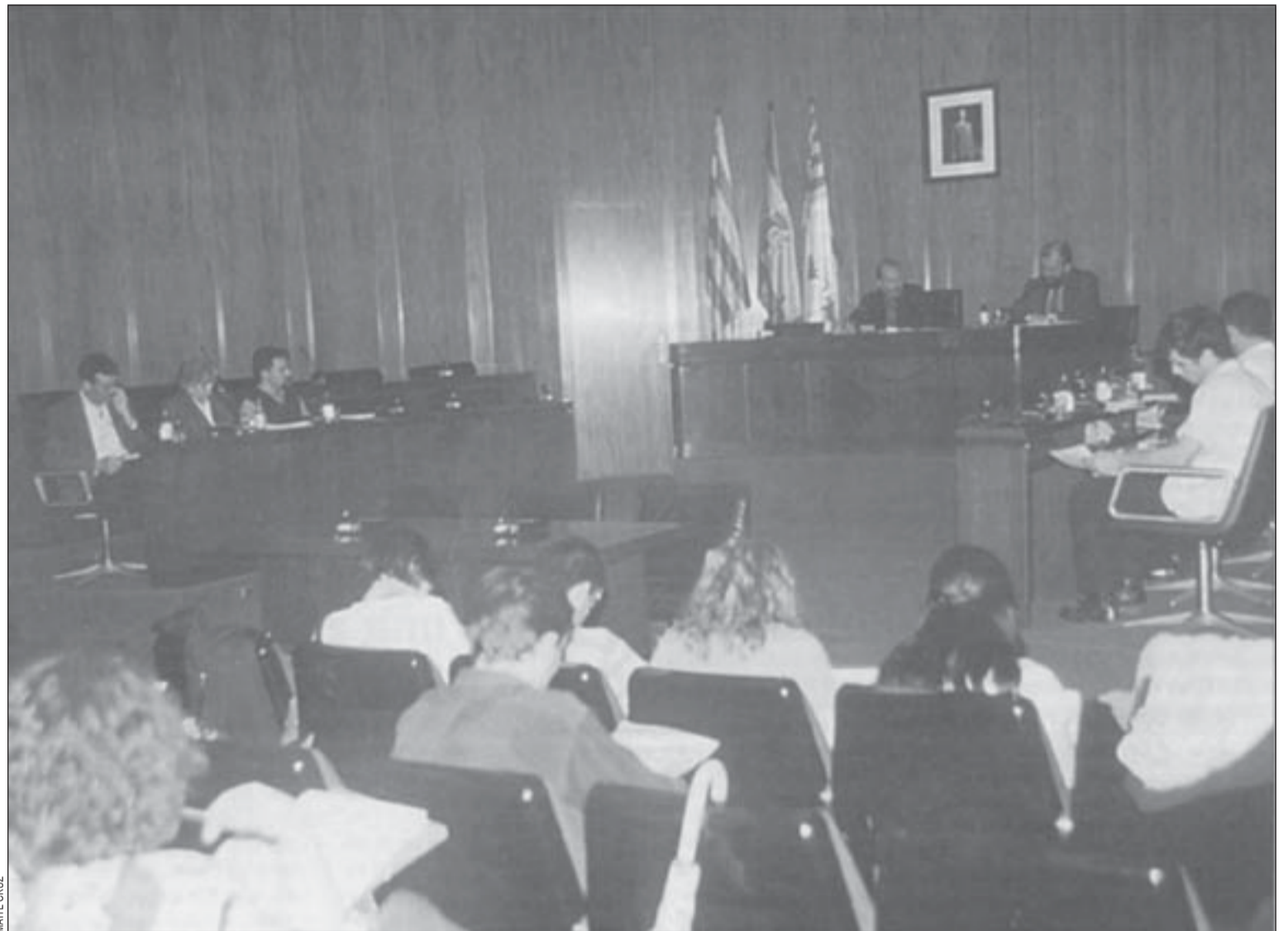
El consell, format per uns setanta representants de tots els sectors del món educatiu de la ciutat, es va constituir al Saló de Plens

Corbacho, en l'acte de constitució, tot i recordar que l'Ajuntament no té competències en ensenyament, va manifestar la seva preocupació perquè "si històricament les reivindicacions anaven lligades a la manca de places, ara s'ha de donar resposta a les peticions de millora de la qualitat". En aquest sentit, l'alcalde va apuntar que l'Ajuntament ha destinat 72 milions de pessetes per a millores escolars, però va dir que "cal reclamar" a la Generalitat, que té les