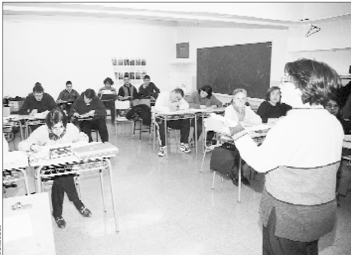
Les escoles d'adults han iniciat el nou curs, l'últim per aconseguir l'actual graduat escolar

L'oferta formativa de les escoles d'adults de L'Hospitalet comprèn des d'aprendre a llegir i escriure fins a l'accés a la universitat. Algunes de les ofertes d'aquest