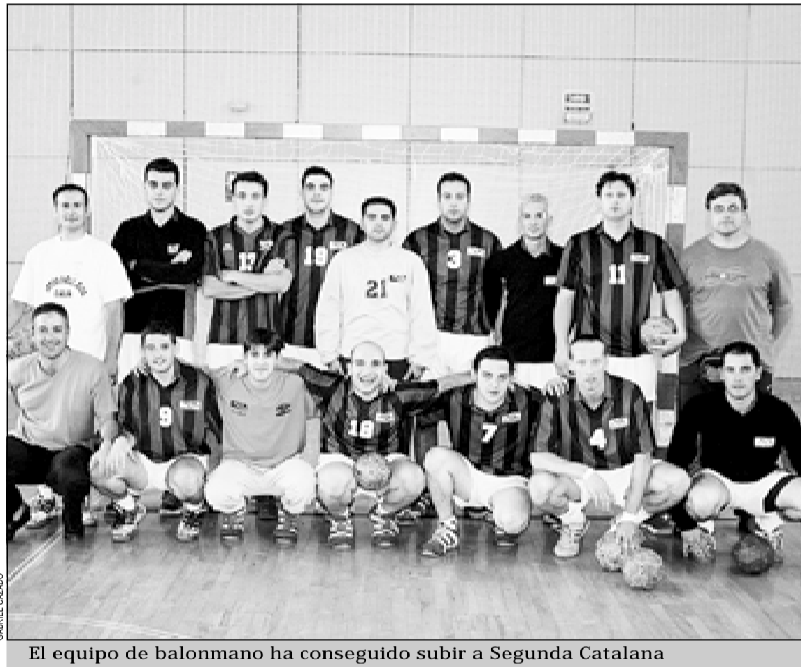
El equipo de balonmano ha conseguido subir a Segunda Catalana

junto masculino acabó la liga en la parte alta de la clasificación.