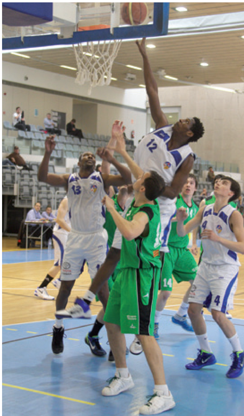
Darrer partit a casa de la lliga entre el CB L'H i el Monte Ducay El Olivar