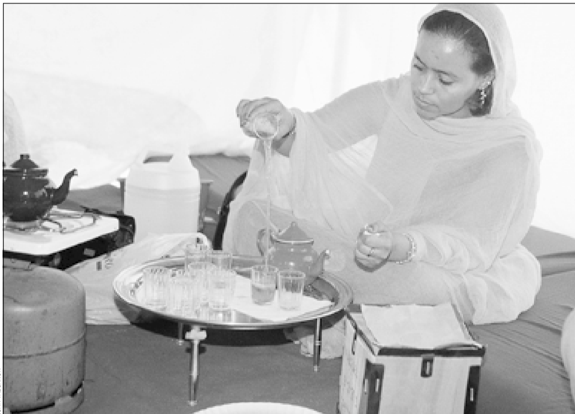
Una jove sahrauí dins una haima a la rambla Just Oliveras durant la campanya solidària anterior

Un any més, els hospitalencs han col·laborat en la recollida de material i de diners per a la sisena Caravana Catalana per la Pau. A mitjan juliol el carregament sortirà cap als campaments de refugiats sahrauís a Algèria. D'altra banda, ja han arribat a la ciutat els 30 nens i nenes que passaran dos mesos amb les famílies acollidores