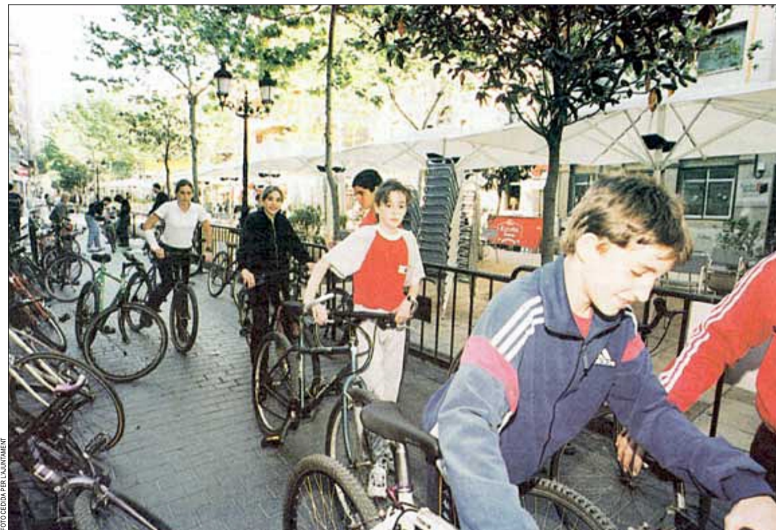
En las paradas de metro se prestarán bicicletas como transporte alternativo al vehículo

El barrio del Centre es una de las zonas más emblemáticas de la ciudad, el centro histórico y administrativo de L'Hospitalet que atrae a gran número de vehículos a diario. Allí se habilitó la primera zona sin coches el pasado año y ahora se consolida ampliando el perímetro reservado a los peatones. La Florida es otro de los barrios con importante densidad de tráfico y este año se estrena con un espacio sin coches en torno a la avenida Masnou.