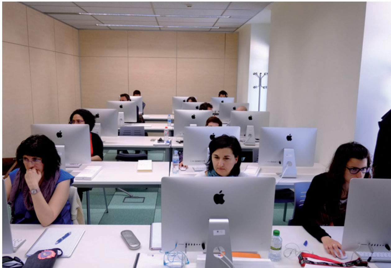
Alumnos de una de las aulas multimedia del nuevo Centro Municipal de Creación Multimedia

"Los jóvenes necesitan oportunidades de formación y aquí tienen las instalaciones adecuadas para ello -explica la alcaldesa Núria Marín-. Las instituciones debemos implicarnos en esta tarea y por eso el Ayuntamiento ha finalizado este equipamiento que nació con la Ley de barrios, pese a que la Generalitat ha paralizado las ayudas. Es una prioridad para L'H".