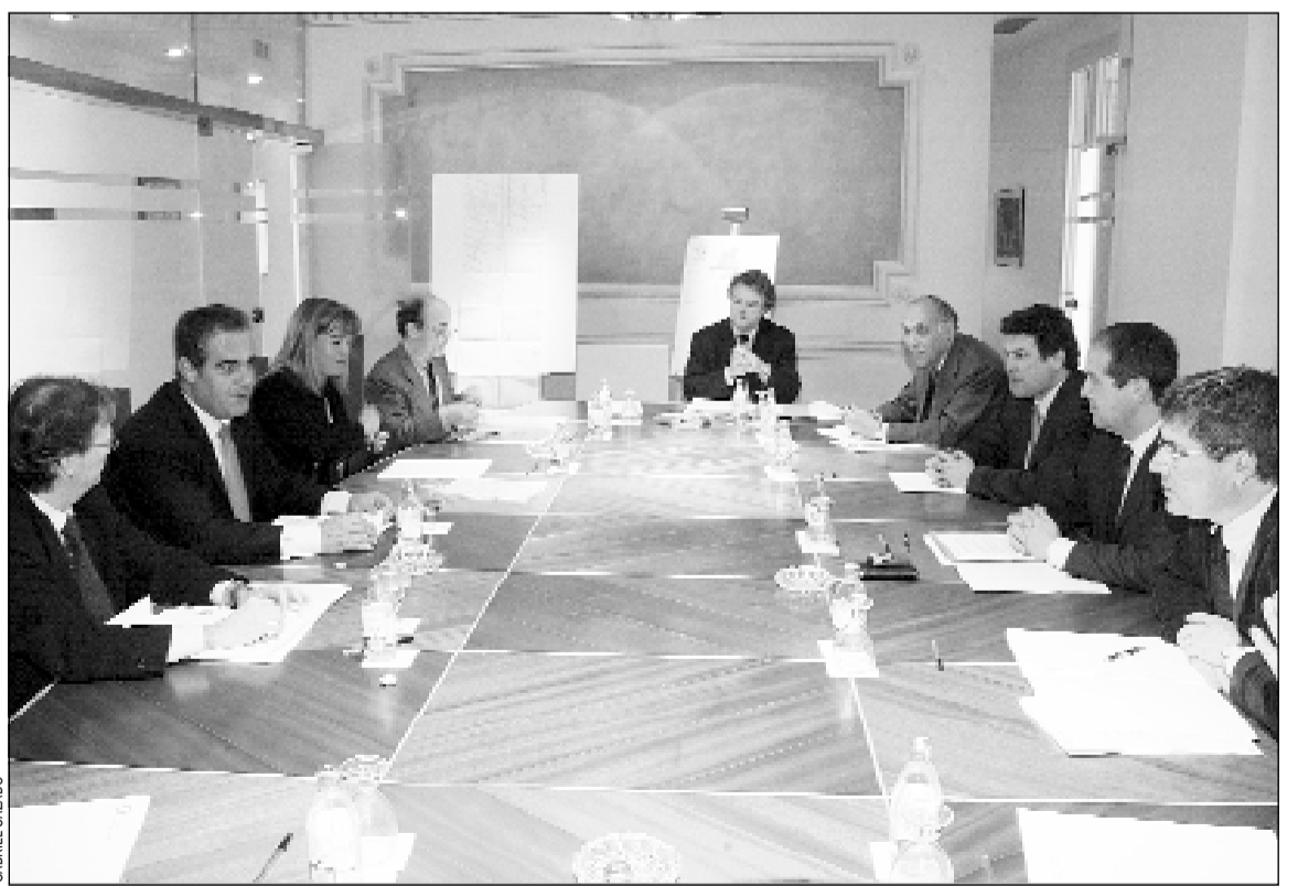
Reunió del Consorci per a la reforma de la Gran Via al Palauet Can Buxeres

La Gran Via és un dels principals accessos a Barcelona i la seva àrea metropolitana des de l'aeroport. Tot i això, discorre d'esquenes a la ciutat i als importants equipaments projectats en el seu entorn: la Fira, la Ciutat Judicial, l'hotel dissenyat per Richard Rogers, el centre comercial Gran Via 2, etcètera. A més, la Gran Via separa el terme municipal i obstaculitza la connexió entre els territoris que travessa.