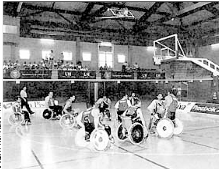
En el campeonato participarán ocho equipos europeos

La mitad de los partidos se jugarán en la pista del Complex Esportiu L'Hospitalet Nord, incluida una de las semifinales (el sábado 29 a las 19h). Los de la última jornada, el domingo, se disputarán en Sant Feliu, con la única excepción del encuentro por la séptima plaza, que también se disputará en