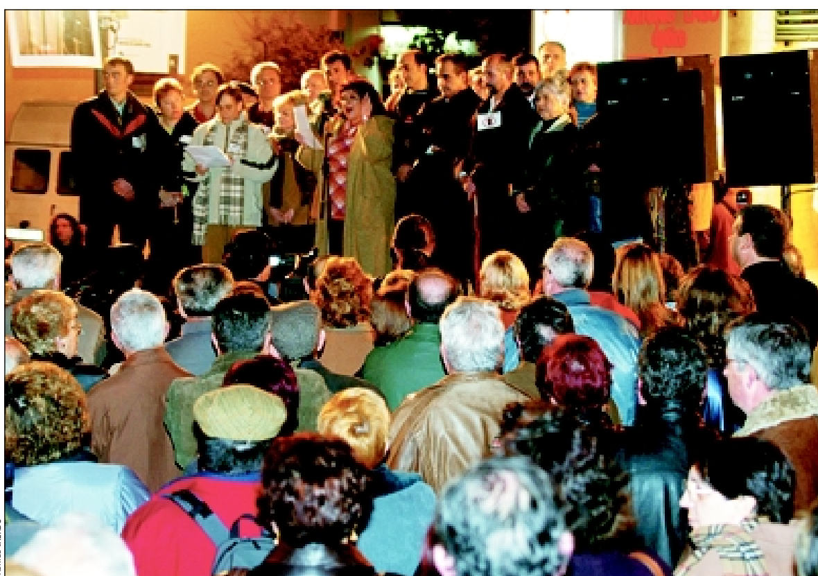
Manifestación de protesta contra el cambio de gestión de las ABS

El manifiesto pide una asistencia primaria universal, equitativa, con más recursos económicos, materiales y humanos gestionada exclusivamente por el ICS. Además esta nueva gestión pondrá en peligro la igualdad en el trato entre los usuarios de los diferentes barrios de la ciudad y fragmentará la asistencia primaria