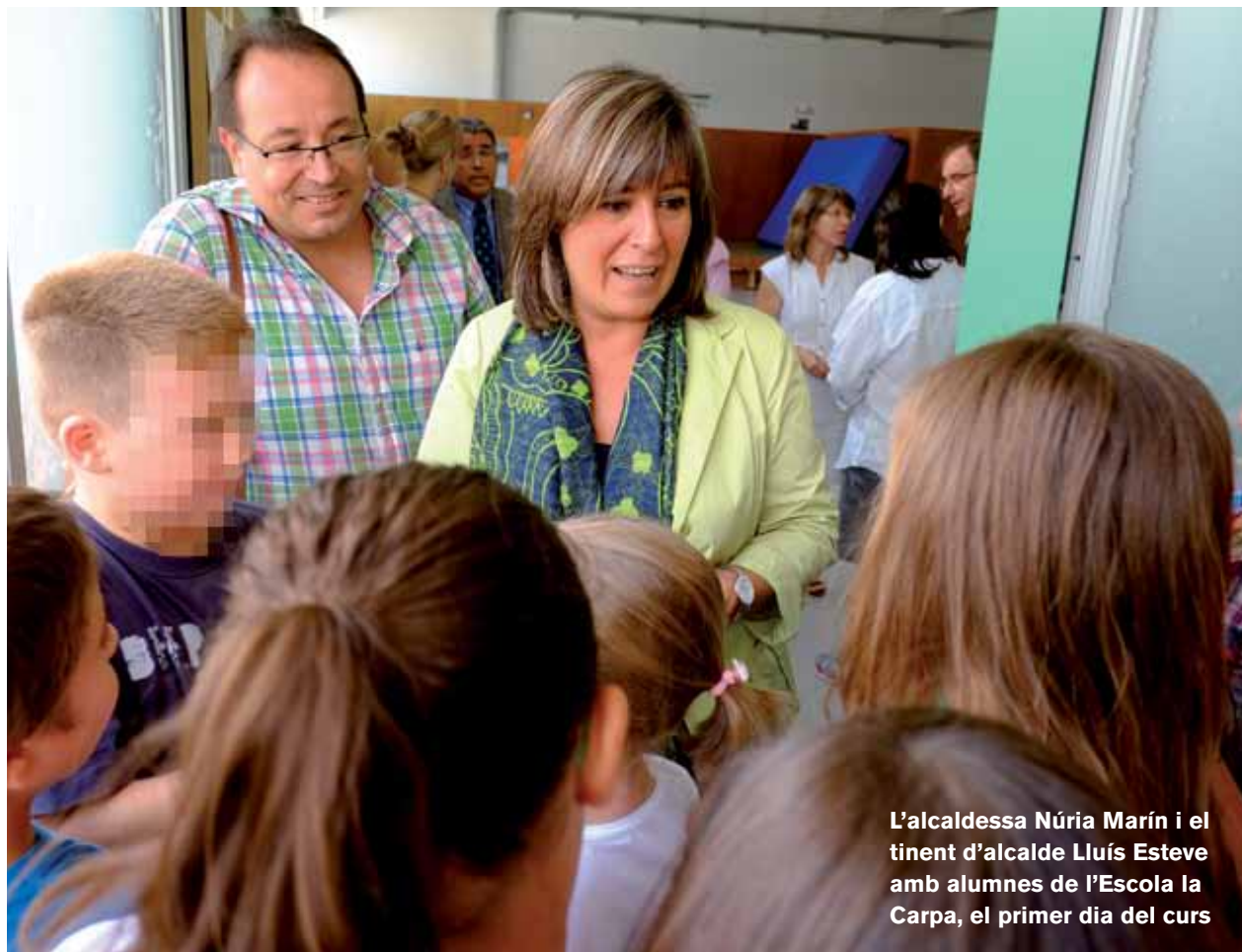
L'alcaldeessa Núria Marín i el tinent d'alcalde Lluís Esteve amb alumnes de l'Escola la Carpa, el primer dia del curs

L'inici del curs escolar marca la normalitat a la ciutat després de les vacances. És un nou curs però arrossega els vells problemes de les darreres temporades: les retallades en els recursos dedicats a l'educació i l'esforç de L'Hospitalet per compensar aquesta situació