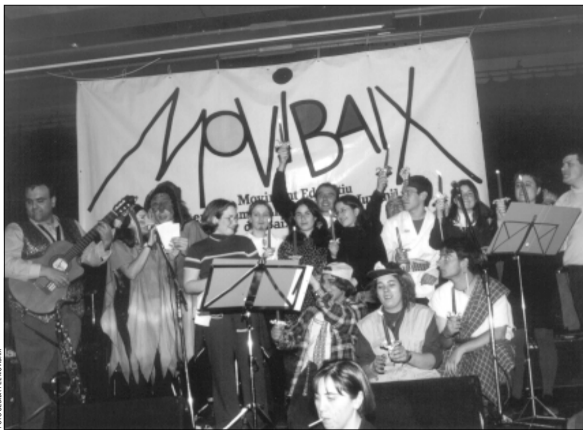
Movibaix va celebrar el seu 15è aniversari, el passat 27 de febrer, amb una gran festa

« L'entitat celebra el seu 15è aniversari amb una gran festa