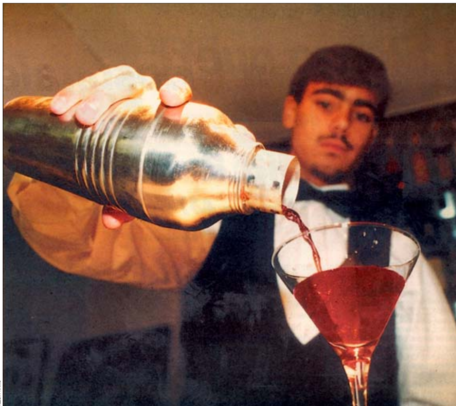
Un 80 por ciento de los alumnos de los cursos de hostelería del IMFO han conseguido encontrar trabajo