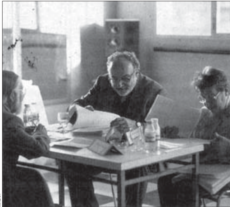
El jurat del premi literari Josep Janés durant la deliberació

El jurat d'aquest V Premi Josep Jané i Olivé ha estat format per l'es-