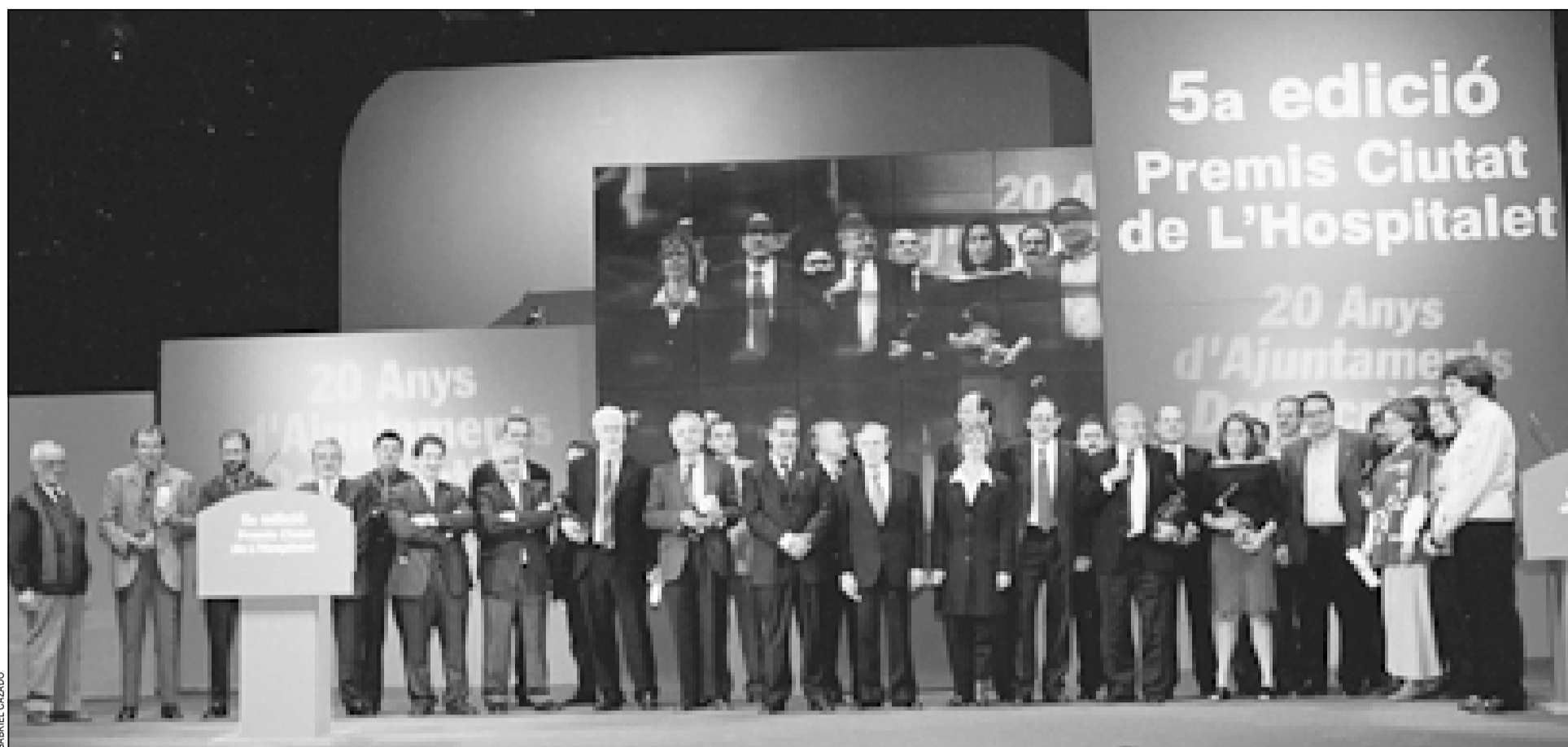
Galardonados y jurado posaron juntos al finalizar la ceremonia de los quintos Premios Ciutat de L'Hospitalet

◆ La ceremonia de los galardones rinde homenaje a los 20 años de ayuntamientos democráticos