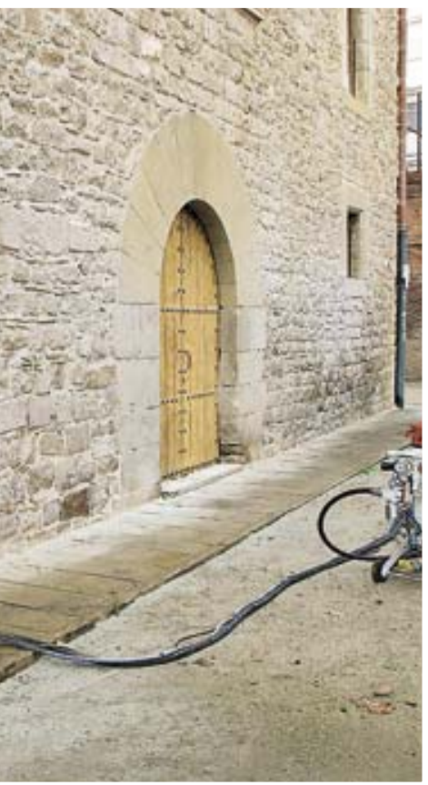
Los edificios catalogados como Civismo ha conseguido

Trabaja para quien vulnera las normas de convivencia