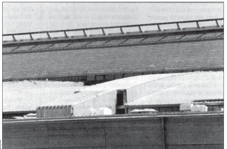
Esta cubierta será uno de los elementos emblemáticos del recinto

tamientos de El Prat y Viladecans ofrecieron también su territorio para albergar los nuevos pabellones feriales. Finalmente, el 10 de febrero de 1993, el Consejo General de la Fira de Barcelona aprueba construir la ampliación de su recinto en Pedrosa. El siguiente paso fue conseguir que el nuevo recinto llevará el nombre de la ciudad para lo que el Pleno municipal dio luz verde a la denominación Montjuïc2/L'Hospitalet en abril del pasado año. Las obras en Pedrosa, adjudicadas a UTE (Unión Temporal de Empresas, formada por Fomento de Construcciones y Contratas y Cubiertas y Mzov) se iniciaron en febrero de 1994 y se han prolongado durante 14 meses. En el nuevo recinto se han invertido 5.750 millones de pesetas.